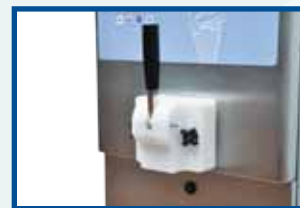
ice-cream extraction block 1 flavour