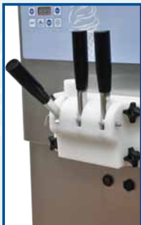
ice-cream extraction block 2 flavours