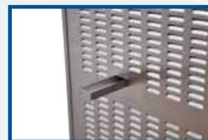
side drip tray